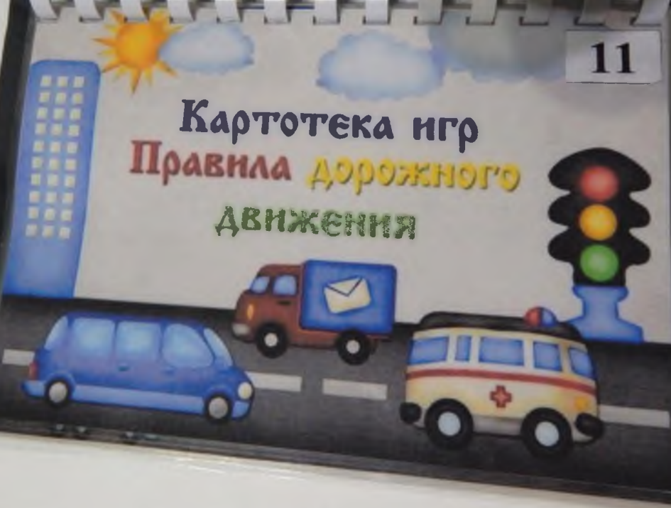
11. Картотека игр «Правила дорожного движения»