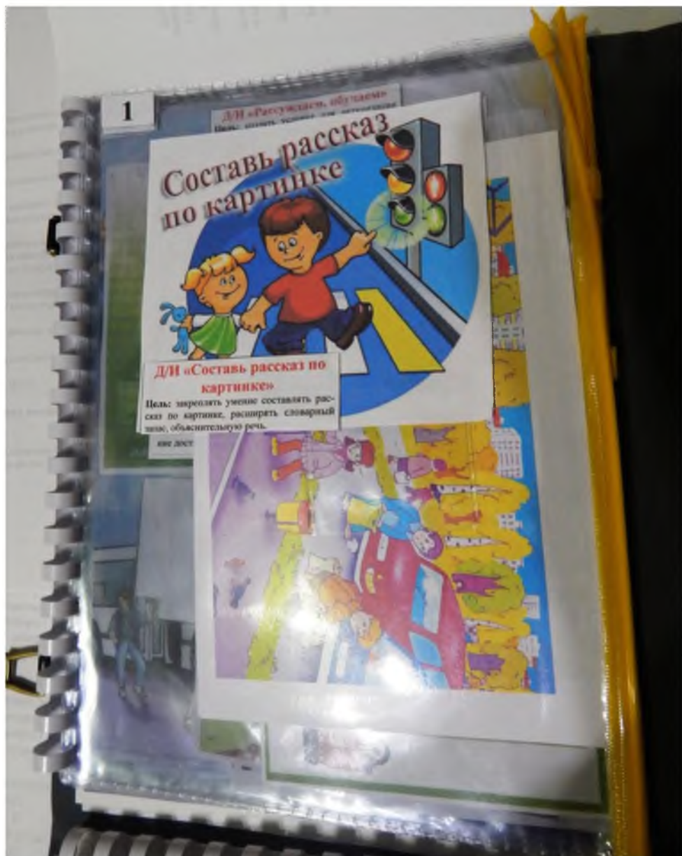
1. Дидактическая игра «Составь рассказ по картинке»