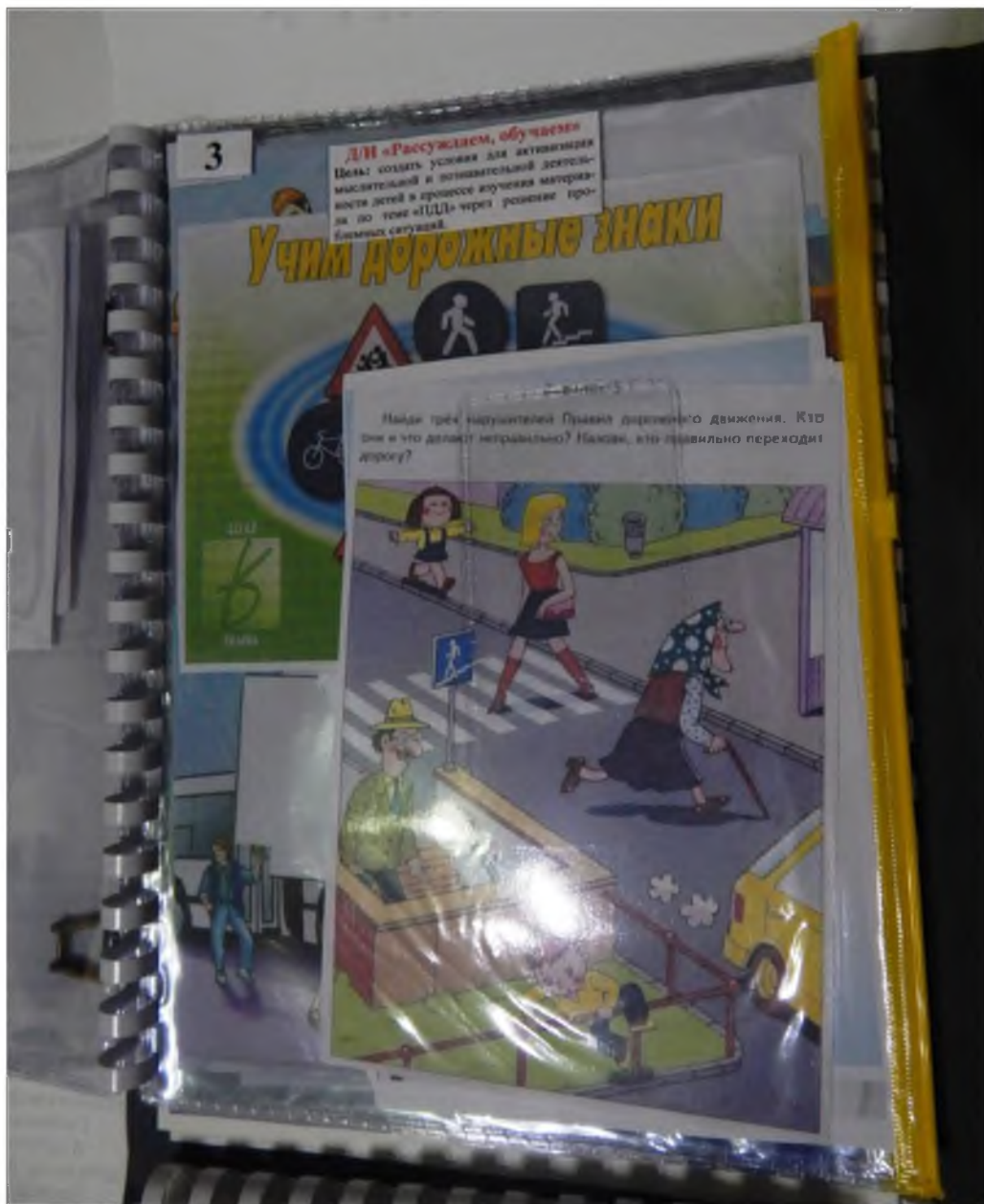
3. Дидактическая игра «Рассуждаем, обучаем»