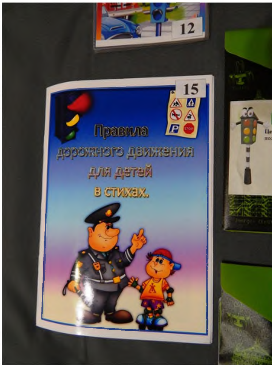
14. Дидактическая игра «Мы спешим в детский сад»