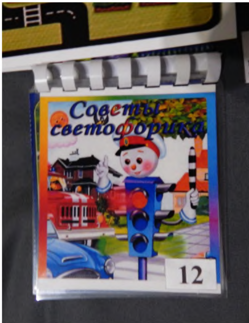
12. Блокнот «Советы светофорика»