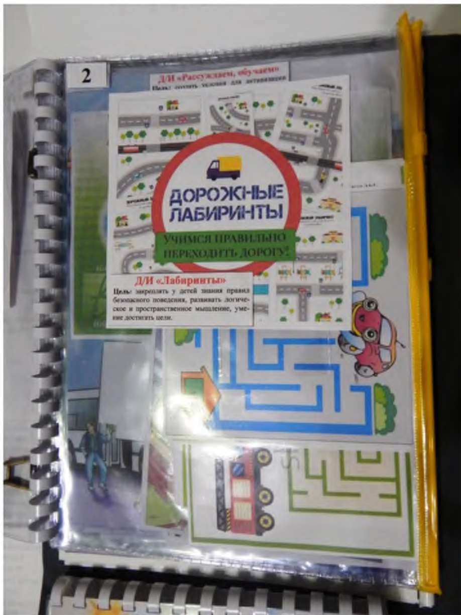
2. Дидактическая игра «Лабиринты»