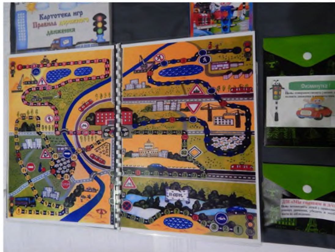
15. Брошюра «Правила дорожного движения для детей в стихах»